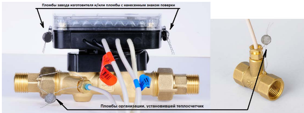
Рисунок 2 – Схема пломбировки теплосчетчика