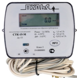
Рисунок 1. Внешний вид теплосчетчика.